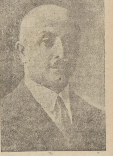
İstifa eden Gümrük ve İnhisarlar Vekili B. Râna Tarhan

Adliye Vekâletine Bolu mebusu Fethi Okyar, Gümrük ve İnhisarlar vekâletine de Trabzon mebusu Raif Karadeniz'in tayinleri Başvekâletçe inha edilmiş ve tayin keyfiyeti Riyaseticumhureca tasvip olunmuştur. Reisi cumhur tezkeresi meclisin bugünkü iktimârında okunmuş vetasvip edilmiş olduğundan Başvekâletçe yeni vekillere tayinleri keyfiyeti tebliğ edilmiştir.