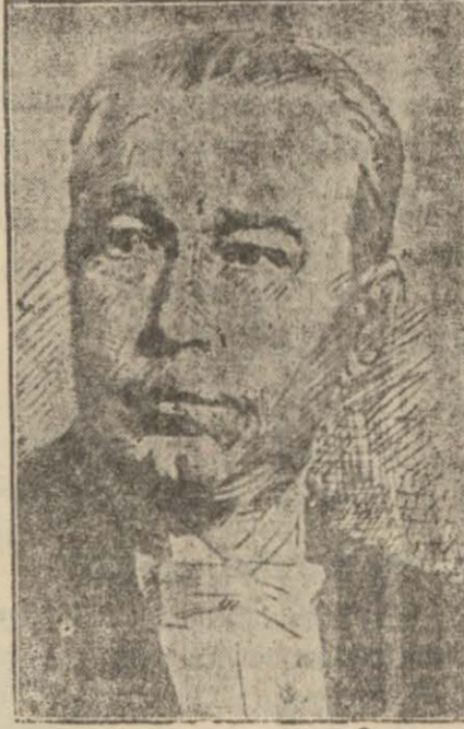
Yeni Adliye Vekilimiz B. FETHİ OKYAR